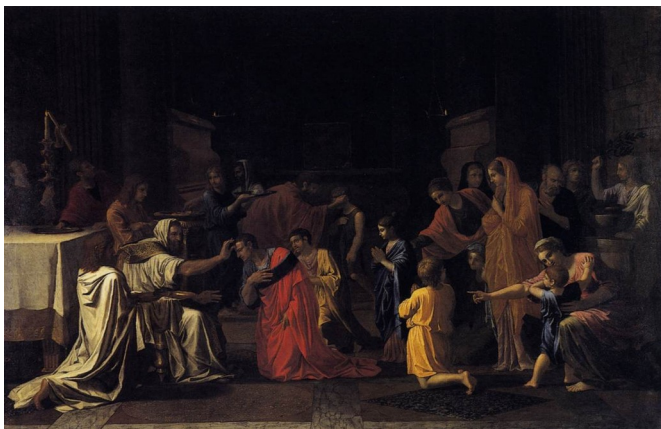
La confirmation – Nicolas Poussin